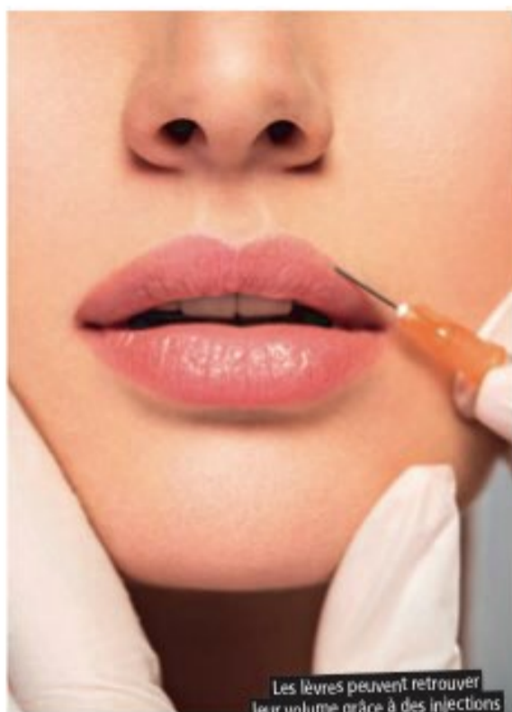
Les lèvres peuvent retrouver leur volume grâce à des injections d'acide hyaluronique.